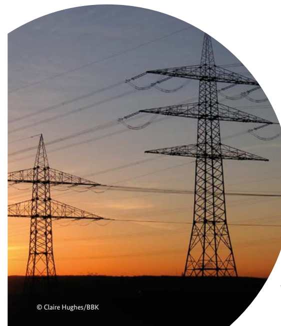
In Deutschland sind längere Stromausfälle selten, aber möglich.

Hinweise für Ihre persönliche Vorbereitung gibt die Broschüre „Ratgeber für Notfallvorsorge und richtiges Handeln in Notsituationen“. Diese ist kostenlos zu beziehen beim Bundesamt für Bevölkerungsschutz und Katastrophenhilfe.